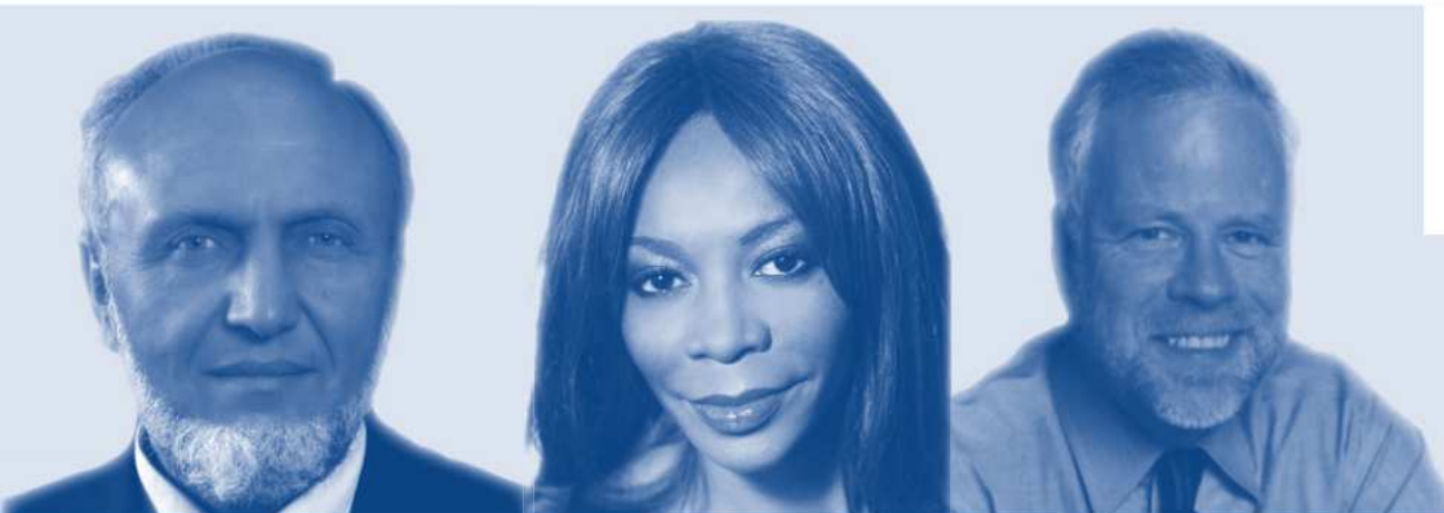
Prof. Dr. Hans-Werner Sinn ifo Institut München